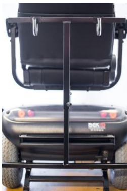
Karma 731 el-scooter vist bagfra med rollatorstativ (rollatorstativ er tilkøb)