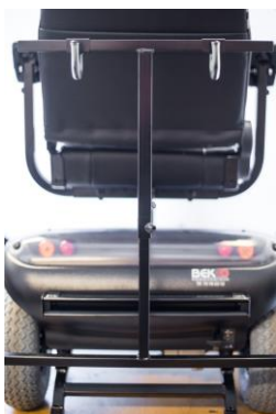
Karma 741 el-scooter vist bagfra med rollatorstativ (rollatorstativ er tilkøb)